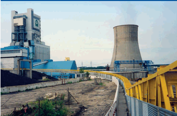
Centrale elettrica – Repubblica Ceca Power station – Czech Republic