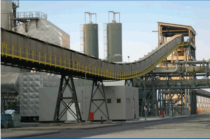
Impianto di calcinazione Coke-Bahrain Coke calcining plant-Bahrain