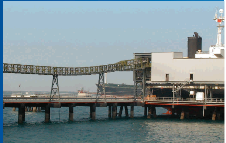
Impianto di calcinazione Coke-Bahrain Coke calcining plant-Bahrain