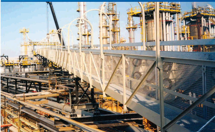
Impianto di trattamento dei fanghi-Italia Sludge treatment plant -Italy