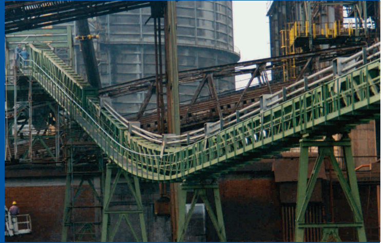
Acciaiera – Italia Steel plant - Italy