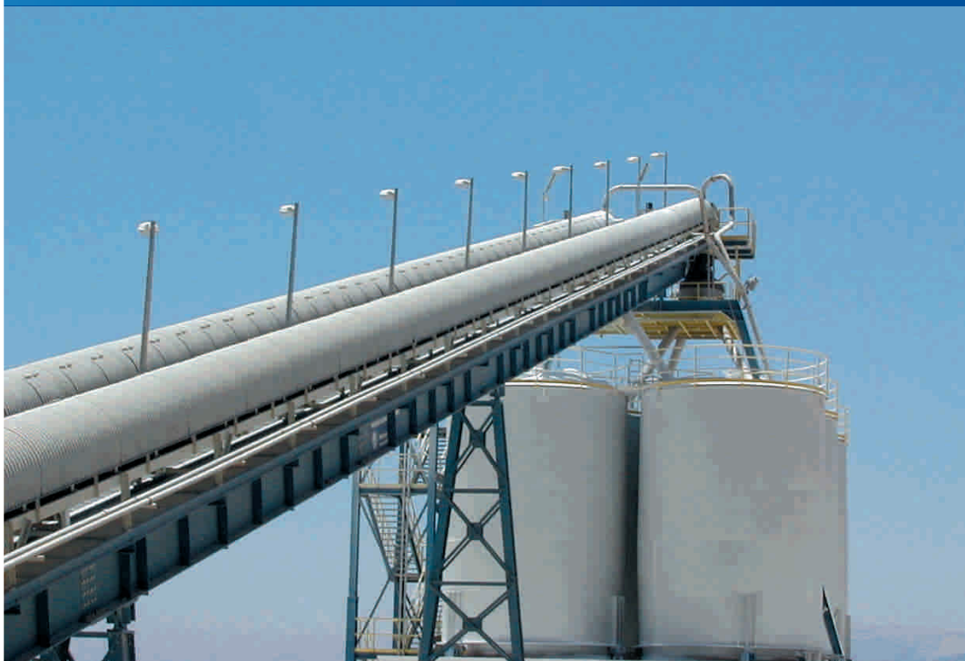
Kemapco - Giordania - Impianto produzione fertilizzanti Kemapco - Jordan - Fertilizer plant