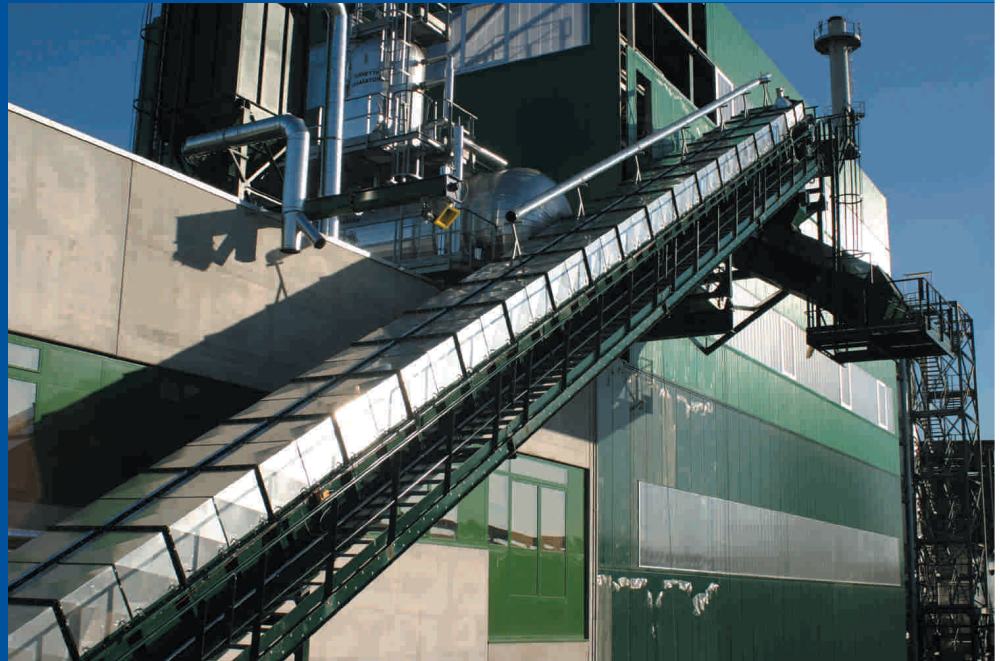
Ecodeco - Italia - Impianto combustione CDR Ecodeco - Italy - Waste burning plant